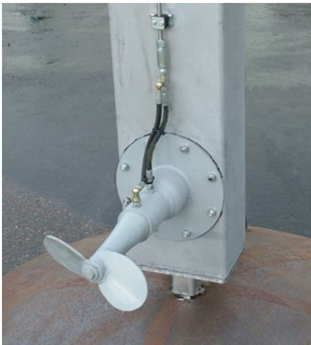
Propellerdiameter 260 alt. 330 mm. Axeln är lagrad med SKF lager och flera radaltätningar för lång livslängd.

Motorn är helt ovan vätskan. Ingen risk att gödsel tränger in i elmotorn. Kilremsdrift! Kilremmarna fungerar som dämpare om propeller träffar på främmande föremål. Omrörarna är konstruerade för enkel kontroll av remspänning och med en robust spännanordning för kilremmar.