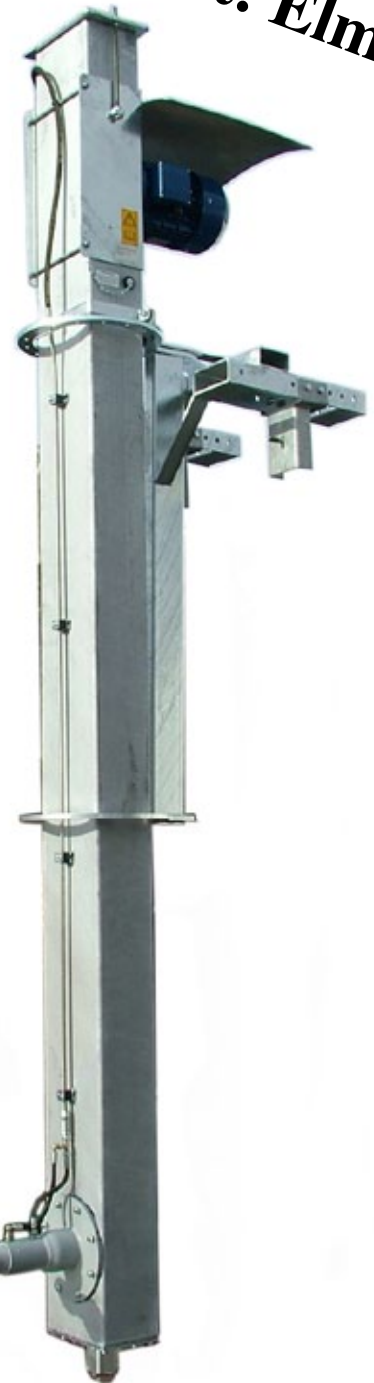
Varmgalvaniserat ramverk och bassängfäste.